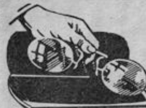
Nr. 165 40 mm breit, Preis 2,20 Mk.