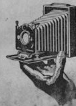
Nr. 193 35 mm breit, Preis 2,20 Mk.