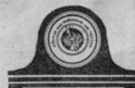
Nr. 201 35 mm breit, Preis 2,20 Mk.