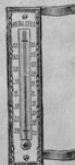
Nr. 232 F 341 19 mm breit Preis 1,30 Mk.