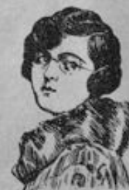
Nr. 205 25 mm breit, Preis 2,20 Mk.